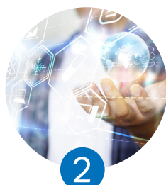
2 La transversalidad de la sostenibilidad a través de la compañía