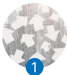
1 El sentido del propósito