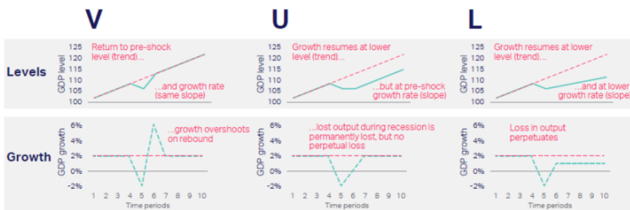
Gráfico 1: los 3 escenarios básicos tras los shocks pueden representarse bajo las formas V-U-L

gravedad de la crisis (escenarios en forma de V, U o L) que afectarán en menor o mayor medida los índices de crecimiento posteriores a la crisis. Estos escenarios representan los posibles contextos en los que una empresa puede estar operando y, como tal, que pueden influir en la forma en la que esta promueve la sostenibilidad y la inclusión.