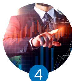
4 La gestión de riesgos