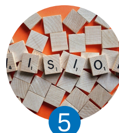
5 Un alineamiento de los objetivos de sostenibilidad con la estrategia empresarial