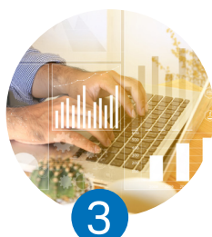
3 La medición del impacto